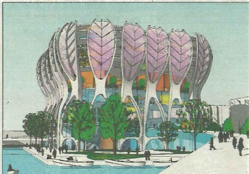
Publiekslieveling 'Bloom' van DOK architecten haalde de eindstreep niet.

In september starten nadere gesprekken met de architect die de toekomstige bieb gaat vormgeven. Dan