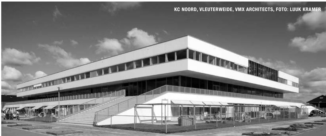
KC NOORD, VLEUTERWEIDE, VMX ARCHITECTS

Het meest recente ontwerp van VMX in Utrecht is natuurlijk de Bibliotheek++ met