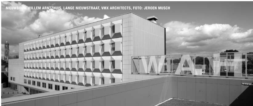
NIEUWBOW WILLEM ARNTZHUIS, LANGE NIEUWSTRAAT, VMX ARCHITECTS, FOTO: JEROEN MUSCH

Na kennis gemaakt te hebben met de (bouw) dynamiek in de historische binnenstad van Utrecht kreeg VMX te maken met het 'archi-