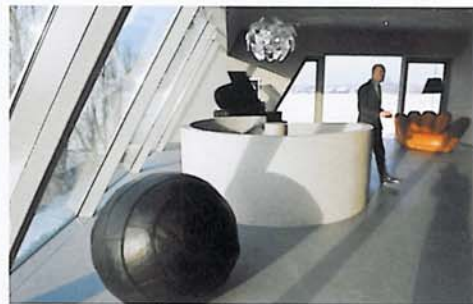
倾斜的玻璃墙壁让主人高自然近在咫尺

“我们喜欢自然,所有的玻璃都让我们感觉和自然是如此接近,它们让我们观察到每个季节、每一天的变化。我们常常在厨房或客厅休息,从我们的卧室放松地看看外面花园和蔬菜地的风景。”