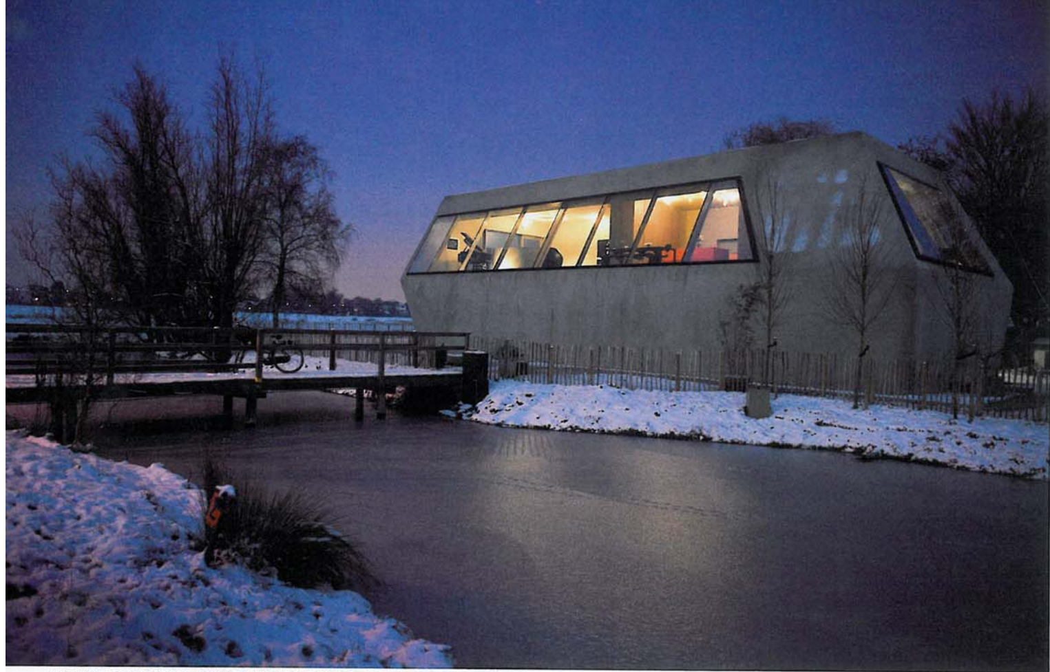
整栋建筑占地面积大约 530 平方米，用水泥块、绝缘材料和金属外壳建造而成，金属外壳之上喷洒了一层水泥